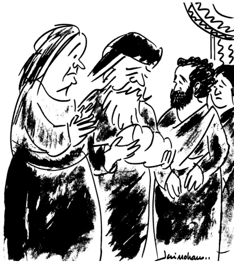
ശിമ്യോൻ രക്ഷകനെ തിരിച്ചറിയുന്നു