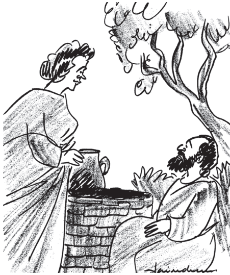
ക്രിസ്തുവും ശമര്യക്കാരി സ്ത്രീയും