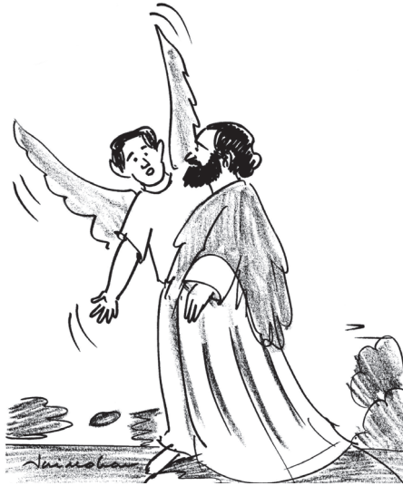
‘നീ ദൈവപുത്രനെങ്കിൽ താഴോട്ടു ചാടുക.’