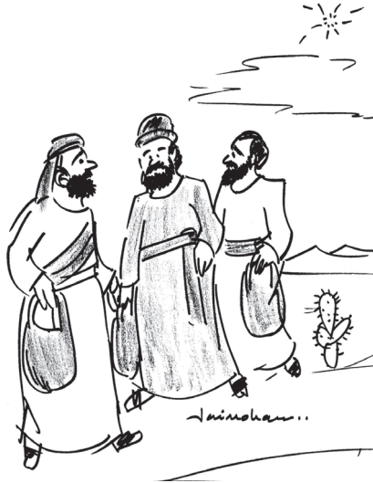
കിഴക്കുനിന്നു മൂന്നു വിദ്വാന്മാർ