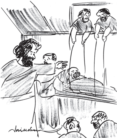
‘മകനേ, ധൈര്യമായിരിക്ക; നിന്റെ പാപങ്ങൾ മോചിച്ചുതന്നിരിക്കുന്നു.’

വേദനയിൽ കഴിഞ്ഞിരുന്ന ആ പക്ഷവാതക്കാരനു യേശുവിന്റെ വാക്കുകൾ ഒരു സംഗീതമന്ദ്രധനിപോലെ അനുഭവപ്പെട്ടു. രക്ഷകൻ പറഞ്ഞു: “മകനേ, ധൈര്യമായിരിക്ക; നിന്റെ പാപങ്ങൾ മോചിച്ചുതന്നിരിക്കുന്നു.”