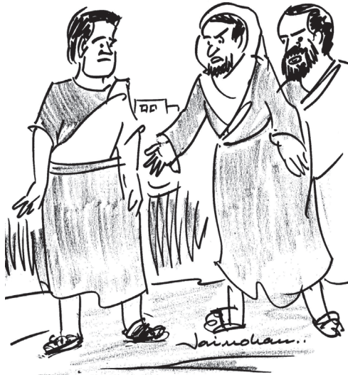
ശത്രുക്കൾ യേശുവിനെ ഭീഷണിപ്പെടുത്തുന്നു